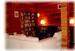
図書室もあります