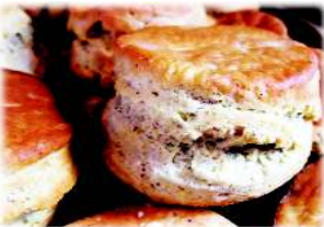
おいしい手作りそば粉のスコーン