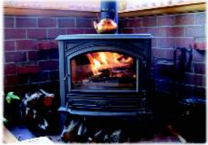
暖炉火は体の芯まで暖まる