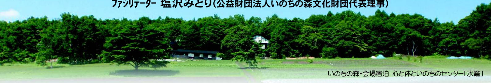
いのちの森・会場宿泊 心と体といのちのセンター「水輪」