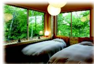
館内は清潔を旨としています