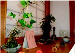
館内に飾られたこけ玉