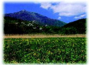
会場から見える飯綱山