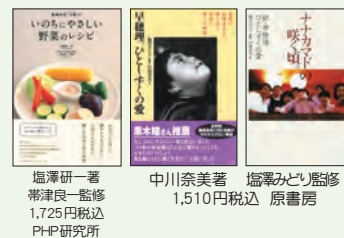
塩澤研一著 帯津良一監修 1,725円税込 PH-P研究所 中川奈美著 塩澤みどり監修 1,510円税込 原書房

いのちの森の大自然のエネルギーは、心と体を癒し、自然治癒力を高めます。隣接する水輪ナチュラルファーム自然農園では農薬や化学肥料を一切使用せず野菜を作り、環境と健康に配慮した農法を行っています。大切に保護された自然は、やどりぎや銀竜草など高山植物、また山野草の宝庫です。館内寝具類は清潔を保ち、施設には和紙の照明、建物は天然木の檜や杉材を使用することで、人工的な建材によって遮断されることなく大自然のもつ澄んだ空気を、存分に味わうことができます。厳選された無添加の食材・調味料、無農薬野菜などを使った心こもった美味しい食事は心身をリフレッシュしてくれます。