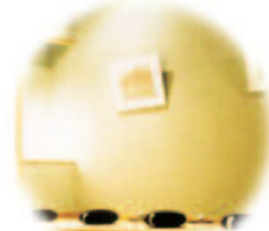
いのちの森坐禅堂