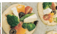
絶品!! フォカッチャ