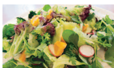
お野菜たっぷりサラダ