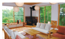
緑いっぱいホール