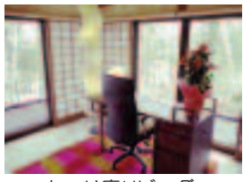
しゅり庵リビング