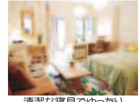
清潔な寝具でゆったり