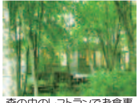
森の中のレストランでお食事

～1日目～ 13:00～ 乗合タクシー・長野県東口発 14:00～ 受付、オリエンテーション 14:30～ 入浴 16:00～ 講義(井上弘寿先生) 18:00～ 夕食 19:00～ 講義(井上弘寿先生) 21:00～ 座禅・個人カウンセリング 22:00～ 就寝 *井上先生による個人カウンセリングは別料金