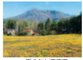
一面のたんぽぽ畑