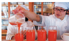
無農薬人参ジュース

2日目 7:00～自然農園散策 8:00～座禅 9:00～朝食 10:00～講義・Q & A 12:30～感想文記入 13:00～終了