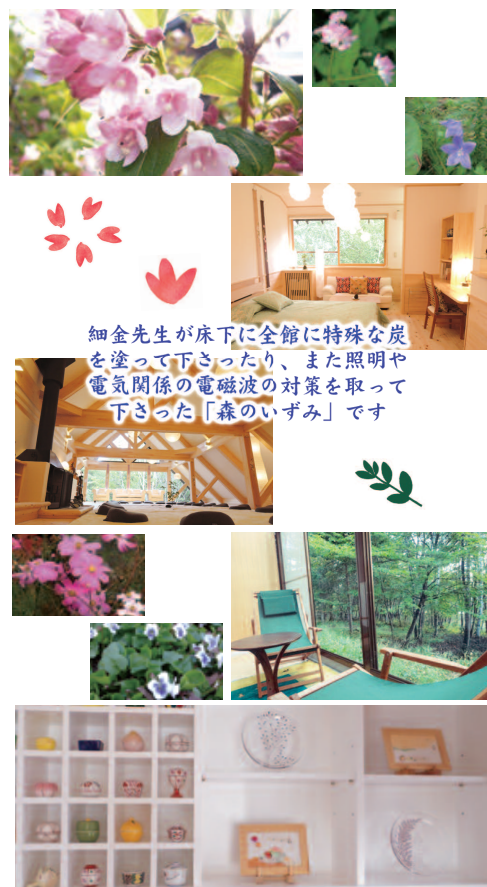
細金先生が床下に全館に特殊な炭を塗って下さったり、また照明や電気関係の電磁波の対策を取って下さった「森のいずみ」です