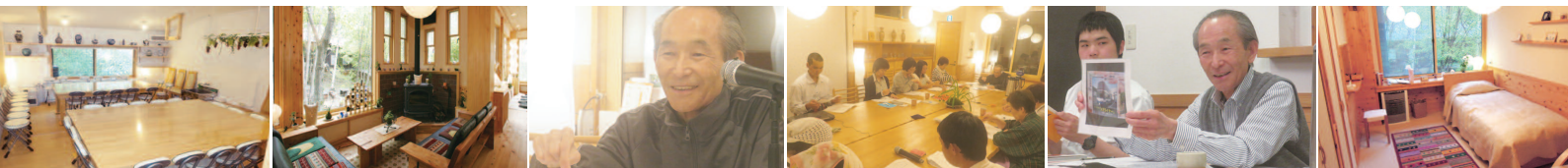
豊富な経験から来る細金先生のわかりやすい講座は、実践を交えながら、質問が飛び交いながら、お互いに共振し合う事を大切にしながら進んでいきます