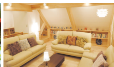
ゆっくりとくつろげる