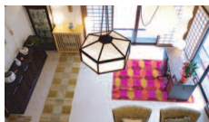
しゅり庵のリビング