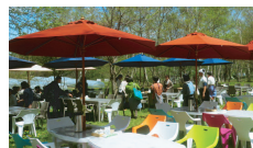
白樺林の中のランチ