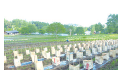
作物の養生 あんどん