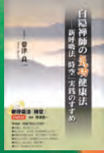
帯津良一著 佼成出版社