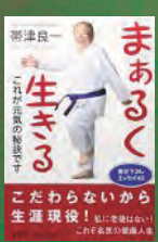
帯津良一著 海竜社