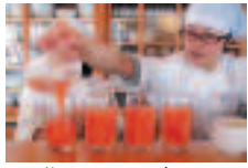
名物にんじんジュース