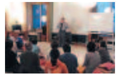
わかりやすい講義