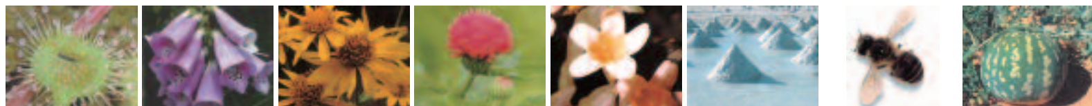
ドロセラ ジギタリス アルニカ・モンタナ カルダス ゲルセミウム ナットムール アピス・メフィリカ コロキンティス