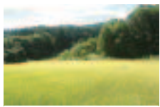
お米も無農薬で育てます