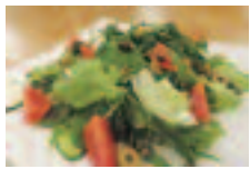
朝採り一番新鮮サラダ