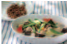
グリーンカレーと酵素玄米