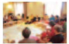
何でもご質問下さい