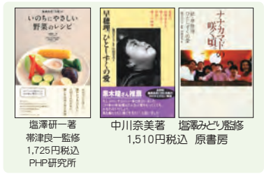
塩澤研一著 帯津良一監修 1,725円税込 PHP研究所 中川奈美著 塩澤みどり監修 1,510円税込 原書房

2016年 がん患者の為に「水輪養生塾」申し込み書 申込日 月 日 TEL 026-239-0010 *該当項目に○をご記入ください FAX 026-239-0011