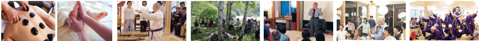
セラピーでのんびり 帯津先生の気功演舞 帯津先生と気功三昧 帯津先生に何でも質問OK 笑顔あふれる懇親会 感動を呼び本気のソラソラ節