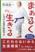
帯津良一著 海電社