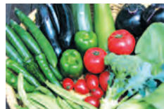
畑の朝採り野菜の食事