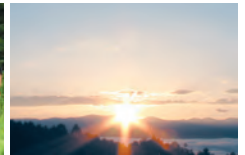
農園からの絶景 朝日