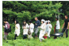
農園散歩リフレッシュ