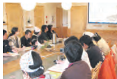
よくわかる脳の仕組み講義