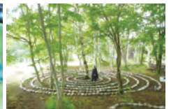
タマヌル 石の螺旋