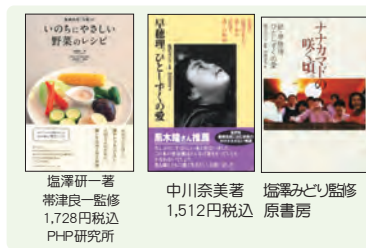
塩澤研一著 帯津良一監修 1,728円税込 PH-R研究所 中川奈美著 塩沢みどり監修 1,512円税込 原書房

いのちの森の大自然のエネルギーは、心と体を癒し、自然治癒力を高めます。隣接する水輪ナチュラルファーム自然農園では農薬や化学肥料を一切使用せずお野菜を作り、環境と健康に配慮した農法を行っています。大切に保護された自然は、やどりぎや銀竜草など高山植物、また山野草の宝庫です。館内寝具類は清潔を保ち、施設には和紙の照明、建物は天然木の檜や杉材を使用することで、人工的な建材によって遮断されることなく大自然のもつ澄んだ空気を、存分に味わうことができます。厳選された無添加の食材・調味料、無農薬野菜などを使った心ごもった美味しい食事は心身をリフレッシュしてくれます。