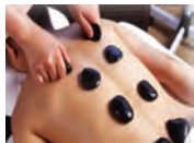
セラピーでのんびり

※車座交流会では椅子もご用意出来ます。 ※毎日の温泉送迎無料 ※⑫戸隠散策送迎無料 ⑬泊宿泊の方は現地解散になります。 4泊以降の宿泊の方は迎車があります