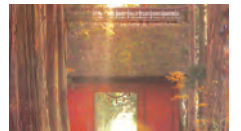
荘厳な戸隠随神門