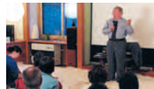
帯津先生に何でも質問OK