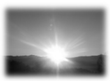
いのちの森から望む日の出